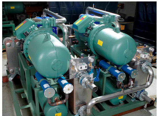
Kuvassa Sahalahden kaksi HP-moduulia.