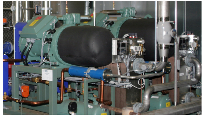
Riihimäelle asennetut kaksi HP-moduulia.